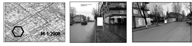
№64. Адрес размещения рекламной конструкции: ул.Советская, д.116/1. Тип рекламной конструкции – щит. Размер рекламной конструкции – 1,47*1,2 м. Количество сторон – 2. Общая площадь информационного поля – 4,32 кв. м.

СВОНДНАЯ ТАБЛИЦА РЕКЛАМНЫХ КОНСТРУКЦИЙ БОРОВИЧСКОГО МУНИЦИПАЛЬНОГО РАЙОНА Адрес установки и эксплуатации РК* "№ РК" по "Схеме" Вид РК Тип РК "Размер РК, м" Кол-во сторон РК Общая площадь информационного поля РК, кв.м. Собственник или законный владелец имущества, к которому присоединяется Рекла. Конструкция. 63. г. Боровичи, ул. Кропоткина, в районе д.№5, схема 63, наружная реклама, сити-формат, размер 1,8 на 1,2 м, 2 стороны, площадь 4,32 кв. м, собственник - Администрация Боровичского района, кадастровый квартал: 53:22:0011531.